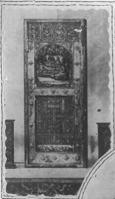
Cofre y búcaros de hierro repujado y cincelado.