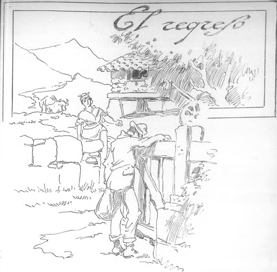
POR HIPOLITO LEON JORDAN