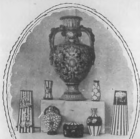
Jarra de Talavera y varios búcaros de porcelana sevillana.

pieta tan sólo de los genios, y con la constancia de los más incansables obreros del Arte, ha llegado a producir cuanto los griegos e italianos hicieron. ¿Fue un visionario? Quizás; pero su noble espíritu, su apellido cien veces ilustre, era el fiel reflejo de sus antepasados. A fines del siglo XVIII ya tenemos a Blas de Zuloaga,