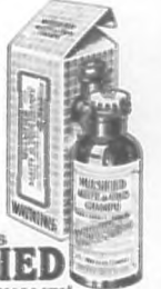
WATKINS MULSIFIED ACETATE OF COCO CHAMPU

Póngase en una tasa con un poco de agua tibia unas dos o tres cucharadas de Mulsified. Móvese sencillamente el cabello y frotelo con este. Basta esta cantidad para obtener una espuma rica y abundante, la cual se enjuaga fácilmente, dejando la cabellera en un estado de limpieza absoluta. El cabello se seca rápida y uniformemente, ha ciendo se flexible, sedoso, ondulado y lustroso. El aceite de coco Mulsified disuelve y quita hasta la última partícula de polvo y caspa. Cuidese de las imitaciones. Exíjase que sea Mulsified fabricado por Watkins.