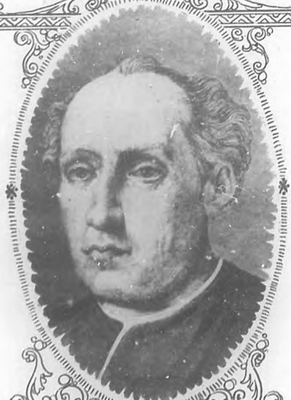
El inmortal navegante D. Cristóbal Colón descubridor del Nuevo Mundo.

El segundo apellido de Colón, era Fonterosa y con este apellido en