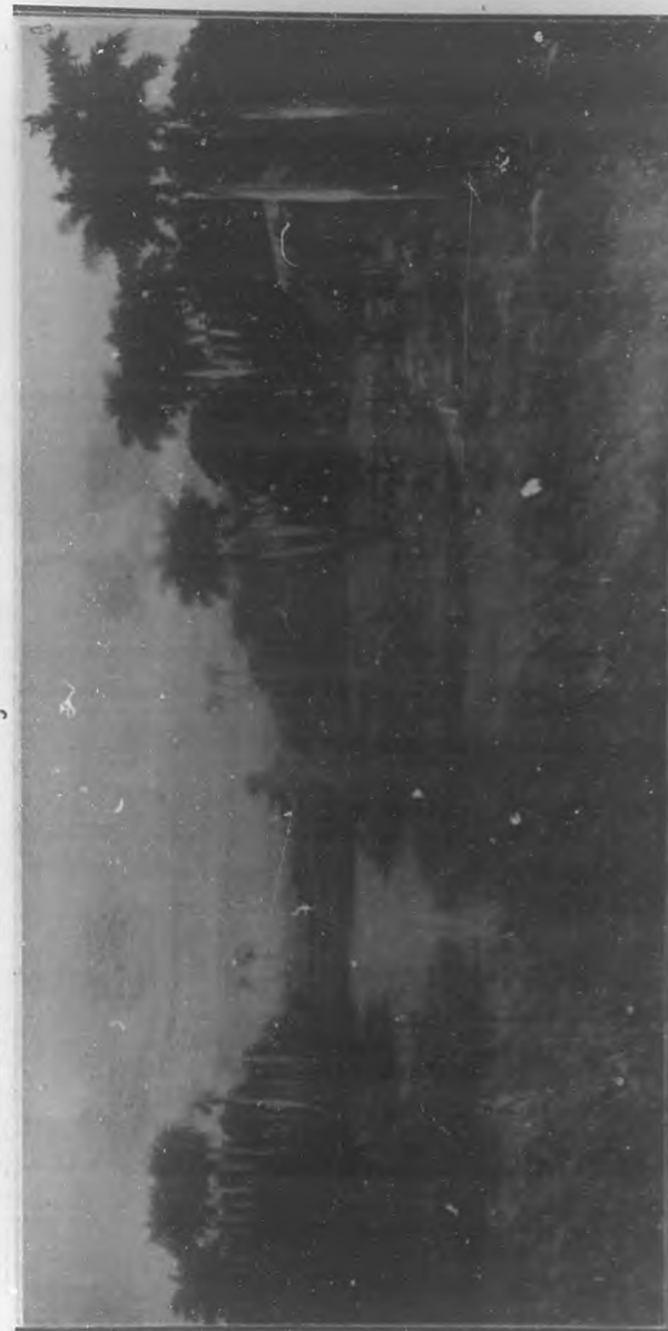
(Grabado original de BOHEMIA)

Si se examina la Historia de los descubrimientos geográficos, los descubridores daban o bautizaban a las tierras que descubrían o conquistaban con nombres de pueblos o de algo de su patria y a Colón no se le ocurrió ni se acordó para nada de Italia, Génova, etc., etc., de cuantos lugares se creen ser cuna suyas, ni tan poco de otras de España donde vivió, luchó o embarcó para ver colmado el logro de su ideal, ni siendo de Pontevedra puso "La Española" y "La Vizcaina", diciendo esto más que nada en confirmación de que Cristóbal Colón y Fonterosa era español y gallego y que si mentía—por conveniencia propia—al negar el verdadero sitio de su nacimiento, al poner nombres a carabelas e islas que descubría, era su Santa María, era su San Salvador, era algo que con esto está por encima de todo, era su alma que decía Galicia.