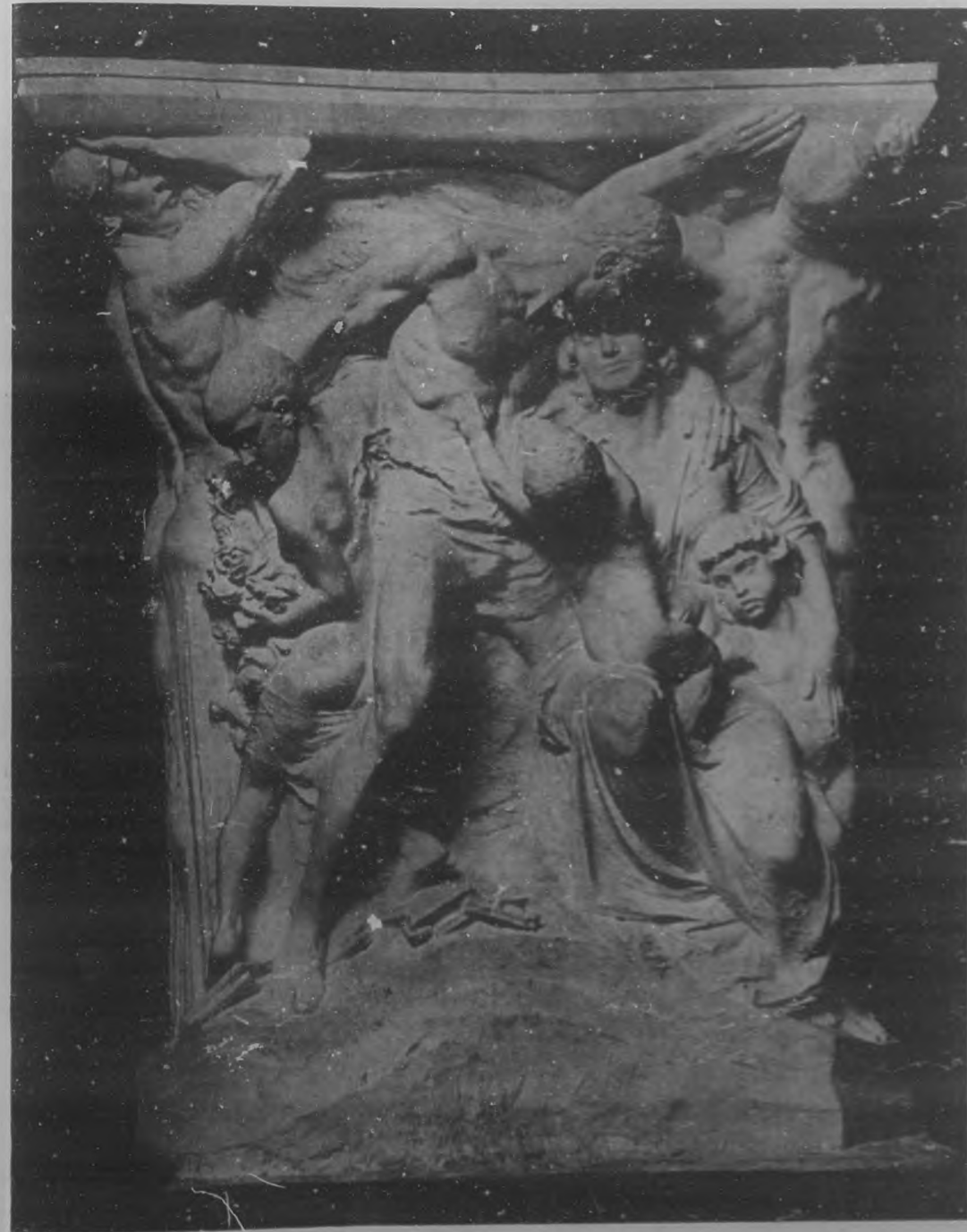
Fragmento del grandioso monumento al ilustre estadista brasileño Nabuco, obra del genial escultor Giovanni Nicolai y que está erigido en el Cementerio de Pernambuco.

Redacción, Administración y Talleres: Edificio de BOHEMIA, Trocadero número 89, 91 y 93. Teléfonos: Dirección M-1000; Administración, A-1018.