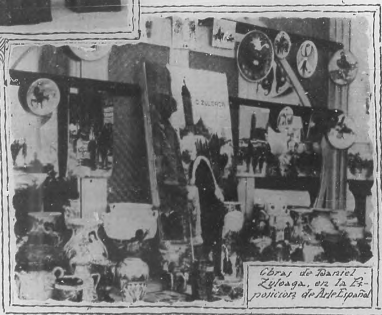
Obras de Daniel Zuloaga, en la Exposición de Arte Español

enseñaran al pueblo que hay algo más grande, más profundo, más vivificador, que los chalets antiestéticos, fastuosos automóviles y grotescas joyas que ultrajan nuestra alma y abofetean la dignidad! Y cuántas veces hemos visto recurrir al suicidio a seres lle-